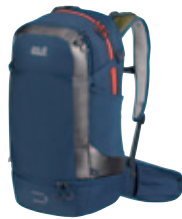
Moab Jam Serie