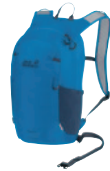
Velo Jam Serie