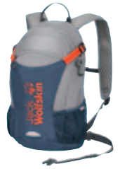
Velo City Serie