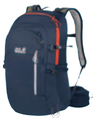
Atmos Shape Serie